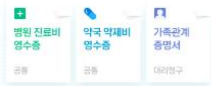
사진 찍어 청구하기